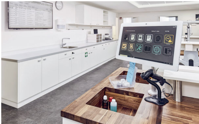
Abb. 2 ilabTouch Terminal mit geöffneter ilabAirport.

oder Scan-Dateien werden in dem integrierten Dokumentenmanagement-System (DMS) direkt zum Patientenfall abgelegt. Das Abheften von Angebots- oder Rechnungskopien entfällt. So sparen Labore Zeit und Lagerraum und haben alle relevanten Daten zu dem Patientenfall immer im direkten Zugriff.