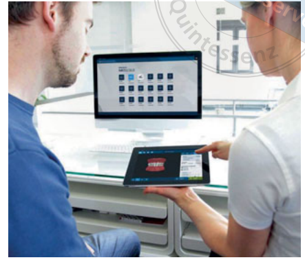
Abb. 1 Anwenderbeispiel aus der Software der Fa. Datext.

Die Abrechnungs- und Managementsysteme von Datext für Dentallabore und Zahnarztpraxen/-kliniken wurden und werden inzwischen von vielen tausend Anwendern im deutschsprachigen Raum genutzt. Inner- und außerbetrieblich stehen diese Softwareprodukte für hohe Qualitätsstandards, intuitive Bedienbarkeit und stetige Weiterentwicklung (Abb. 1). Dabei geht es nicht nur um